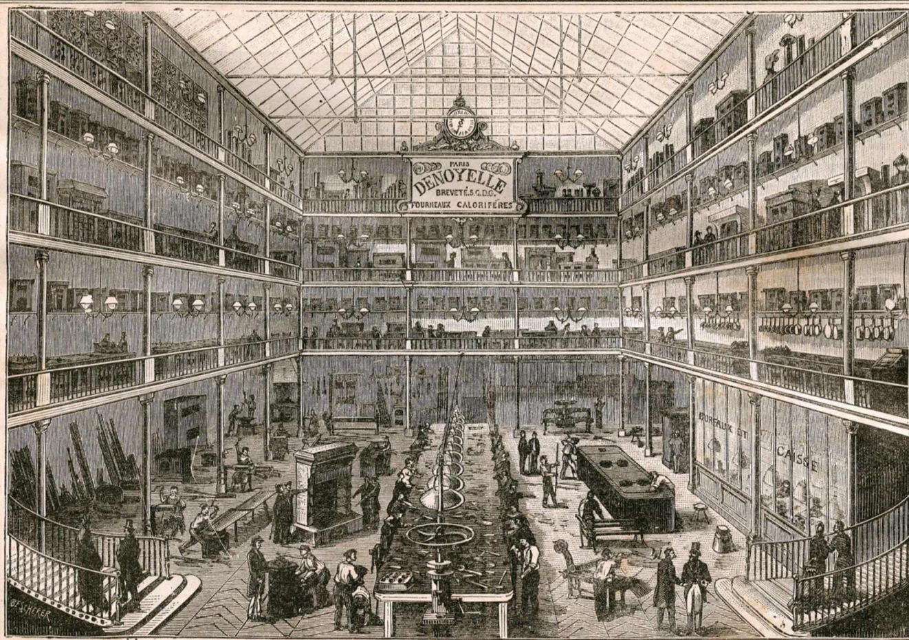
Vue des bureaux, magasins et ateliers de la maison Denoyelle, les plus vastes du monde pour cette industrie

SPÉCIALITÉ DE FOURNEAUX POUR HOTELS, RESTAURANTS, LIMONAIERS, COMMUNAUTÉS, MAISONS BOURGEOISES & TOUTES INDUSTRIES