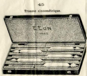
45 Trousses alcoométriques.