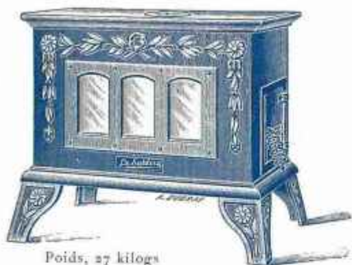
Poids, 27 kilogs