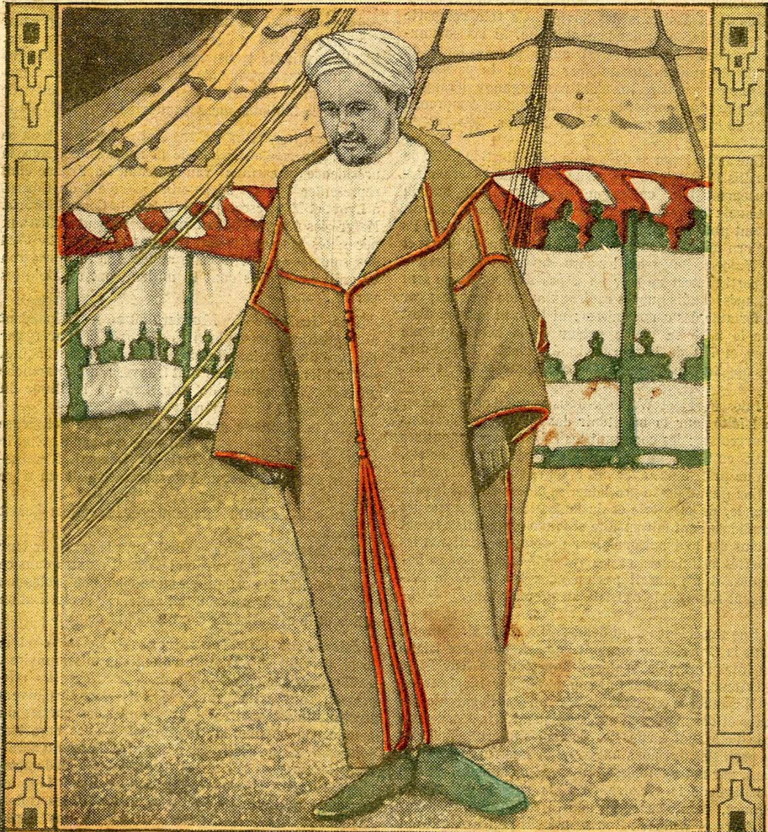
Abd-el-Krim, qui sent le Maroc lui échapper, tente une suprême résistance.

Chèques postaux : MAISON DE LA BONNE PRESSE, compte courant N° 1663-PARIS RÉDACTION & ADMINISTRATION — 5, RUE BAYARD — PARIS-VIII e