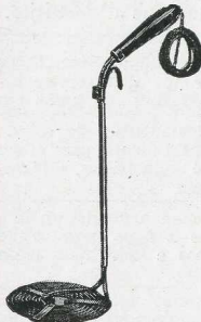
N° 1191. Plongeur coudé pour le chauffage :: des liquides. :: Bent diver for heat- ing liquids.

Submergidor aco- dado para calentar líquidos.