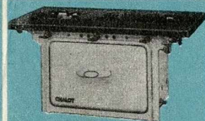
RÉCHAUD N° 186

CHÈQUES POSTAUX: 20.703 PARIS R.C. SEINE 243 229 B