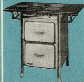
CUISINIÈRE N° 165