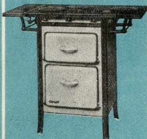
CUISINIÈRE N° 170 bis