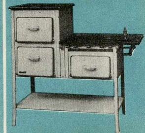
CUISINIÈRE N° 180