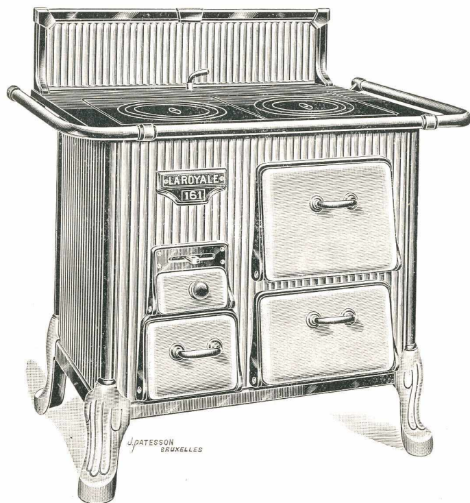
Figurée ci-dessus avec petit dossier