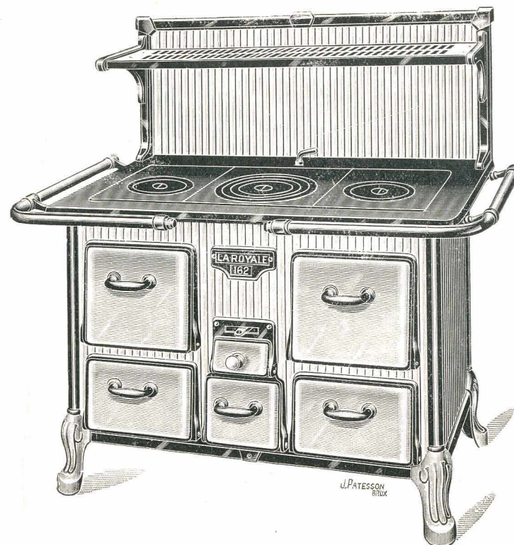
Figurée ci-dessus avec grand dossier et étagère