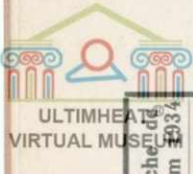
Planche de l'album 1934