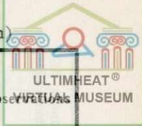
Planche de l'album 1934