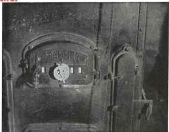
Fig. 2. — Vue d'une chaudière, porte fermée, montée avec un Economiseur « Edco ».

Tous nos appareils portent notre garantie pour leur bon fonctionnement et contre tout vice de fabrication pour une période de 5 ans et nous garantissons une économie minimum de 25 % sur les charbons anthraciteux qui peut atteindre 35 % sur les charbons gras.