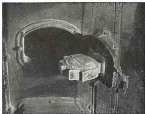
Fig. 1. — Vue d'une chaudière, porte entr'ouverte, montée avec un Economiseur « Edco ».

L'appareil «EDCO» pour but de récupérer les gaz produits par la combustion du charbon qui, dans les chaudières ordinaires, s'échappent non brûlés, par la cheminée.