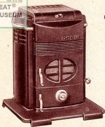
Foyer hygiénique, feu visible N° 421

Hauteur..... 0.610 Chauffe environ..... mc. 100 Poids approximatif d'exp... K os 87 PRIX : Émail noir..... Fr. 460. » — Émail céramique... Fr. 515. » — Émail marbré..... Fr. 565. »