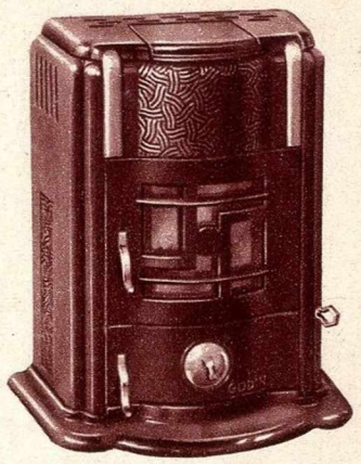
Foyer hygiénique, feu visible N° 424

Hauteur..... 0.610 Chauffe environ..... mc. 100 Poids approximatif d'exp... K os 87 PRIX : Émail noir..... Fr. 460. » — Émail céramique... Fr. 515. » — Émail marbré..... Fr. 565. »