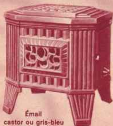
Émail castor ou gris-bleu

Sur demande : Plateau de parquet 620 x 480.