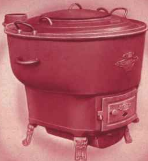
Buanderie modèle RB