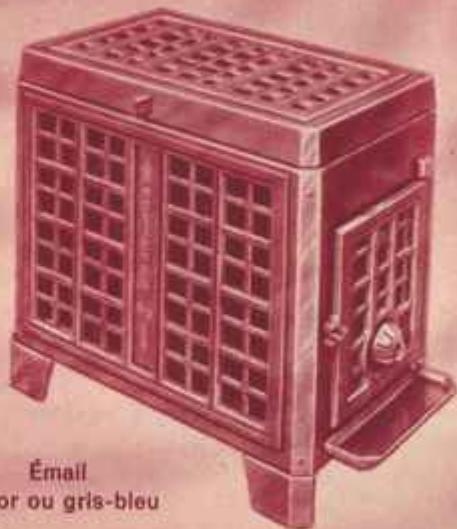
Émail castor ou gris-bleu