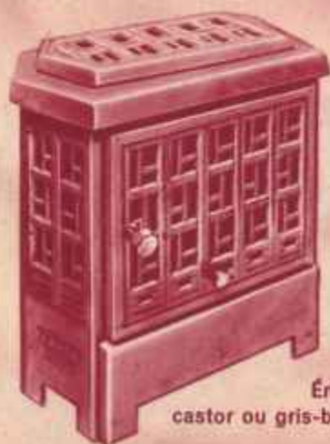
Émail castor ou gris-bleu

Sur demande : Plateau de parquet 620 x 480.