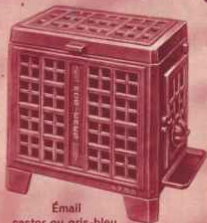
Émail castor ou gris-bleu

Sur demande : Plateau de parquet 620 x 480.