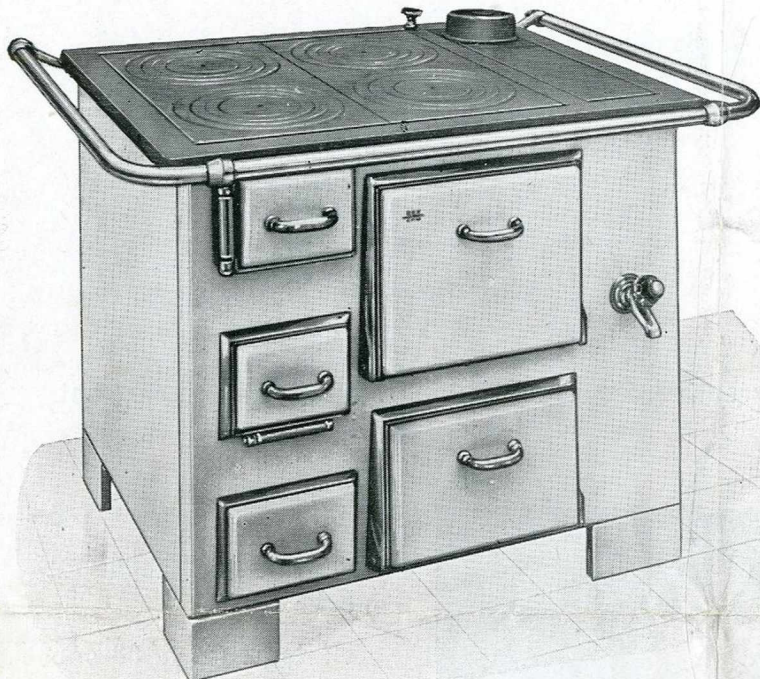
N° 82-64 M