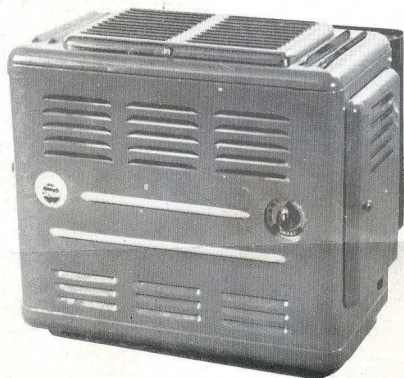
3 B 5 34.000 fr.

Nous pourrions livrer, dans quelque temps, un appareil à air pulsé, permettant de chauffer des locaux industriels et commerciaux d'environ 300 m 3 .