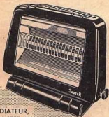
RADIATEUR, CHAUFFE AU RAS DU SOL