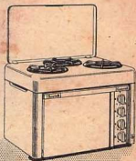
RÉCHAUDS-FOUR ÉLECTRIQUES MIXTES ET "TOUS GAZ"