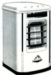
Pb 9 super

MAGASIN D'EXPOSITION : 42, Boulevard Richard-Lenoir, PARIS-XI e