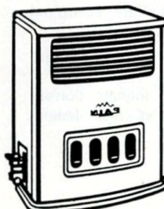
Stella P2 luxe