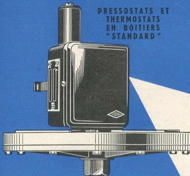
PRESSOSTATS ET THERMOSTATS EN BOITIERS "STANDARD"