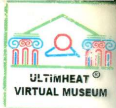
TABLEAU N° IV

(A.N.F., F 14-1091, tableau des mines de l'Empire français en 1810)