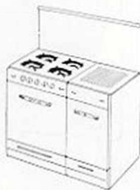
BUTA FLORE Cuisinière 4 feux 1 four Cache Bouteille