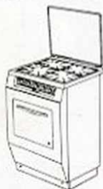
Modèle 857 VALMY Cuisinière 4 feux 1 four - Multigaz tout Fonte émaillée