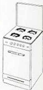
FLORE Cuisinière 4 feux 1 four Multigaz Thermostat Tôle acier