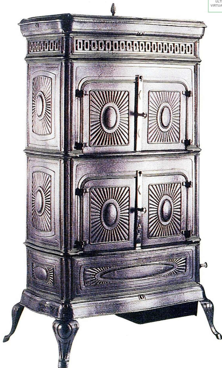
Le fourneau vosgien (1926).