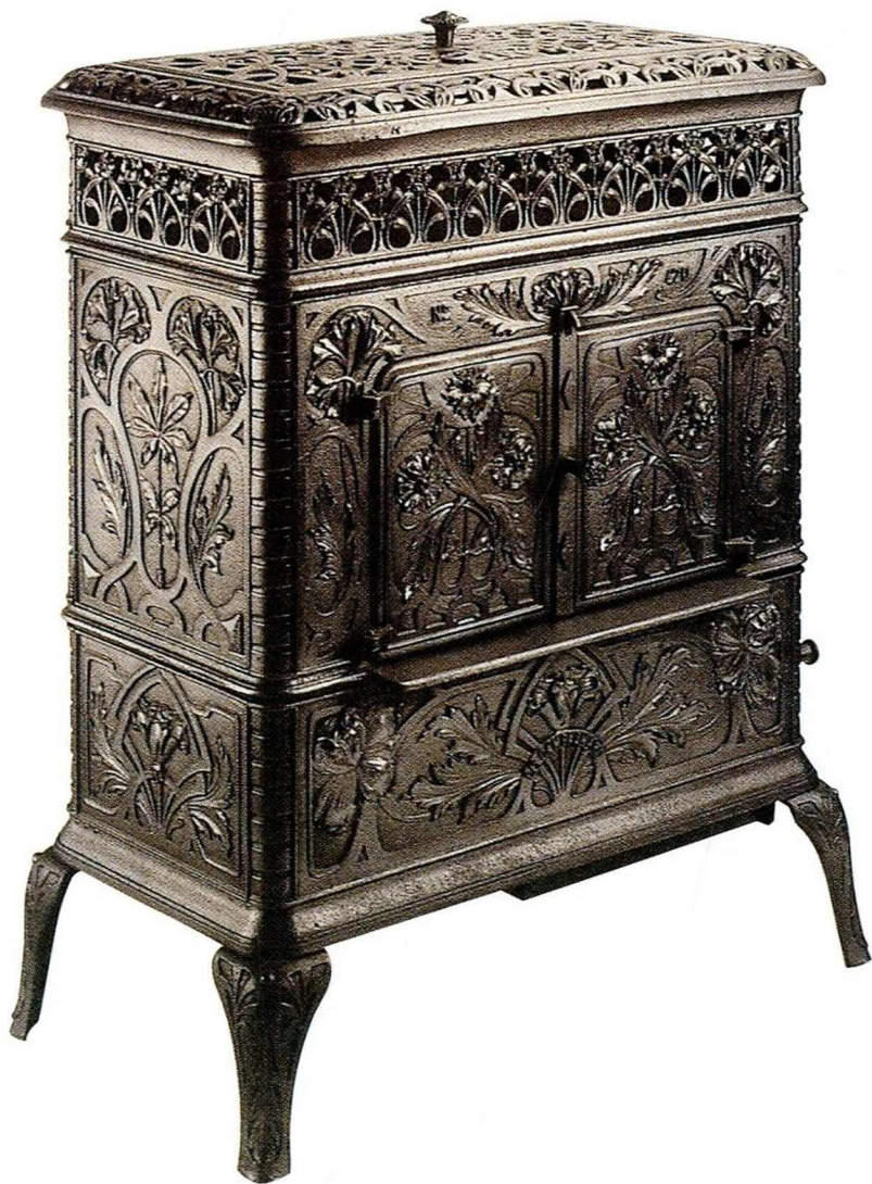
Le fourneau campagnard (1926).