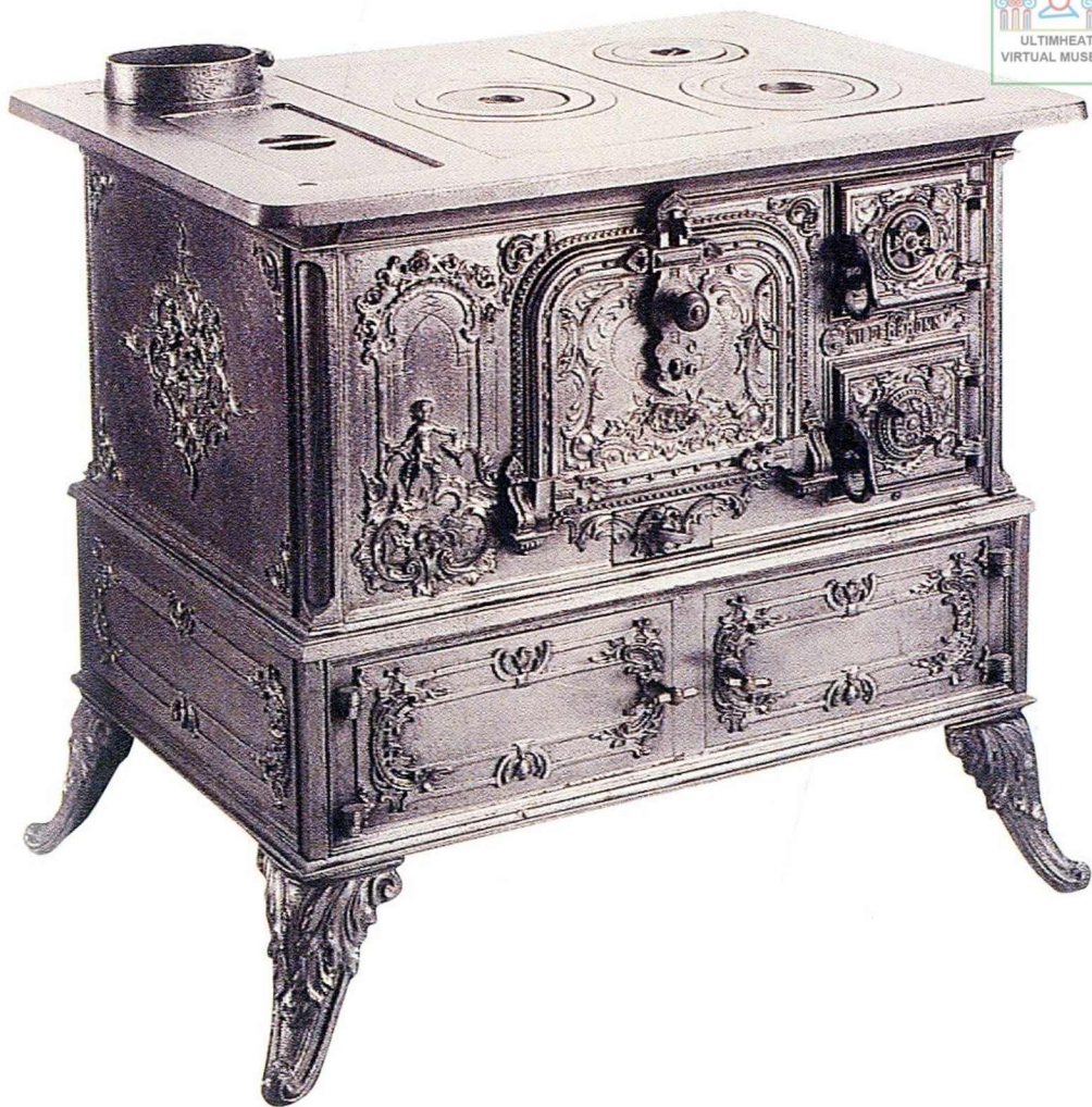
La cuisinière de Mertzwiller (1910).