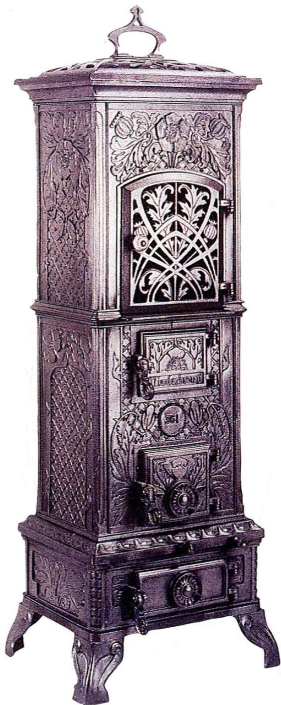
Le fourneau Darmstadt (1911).