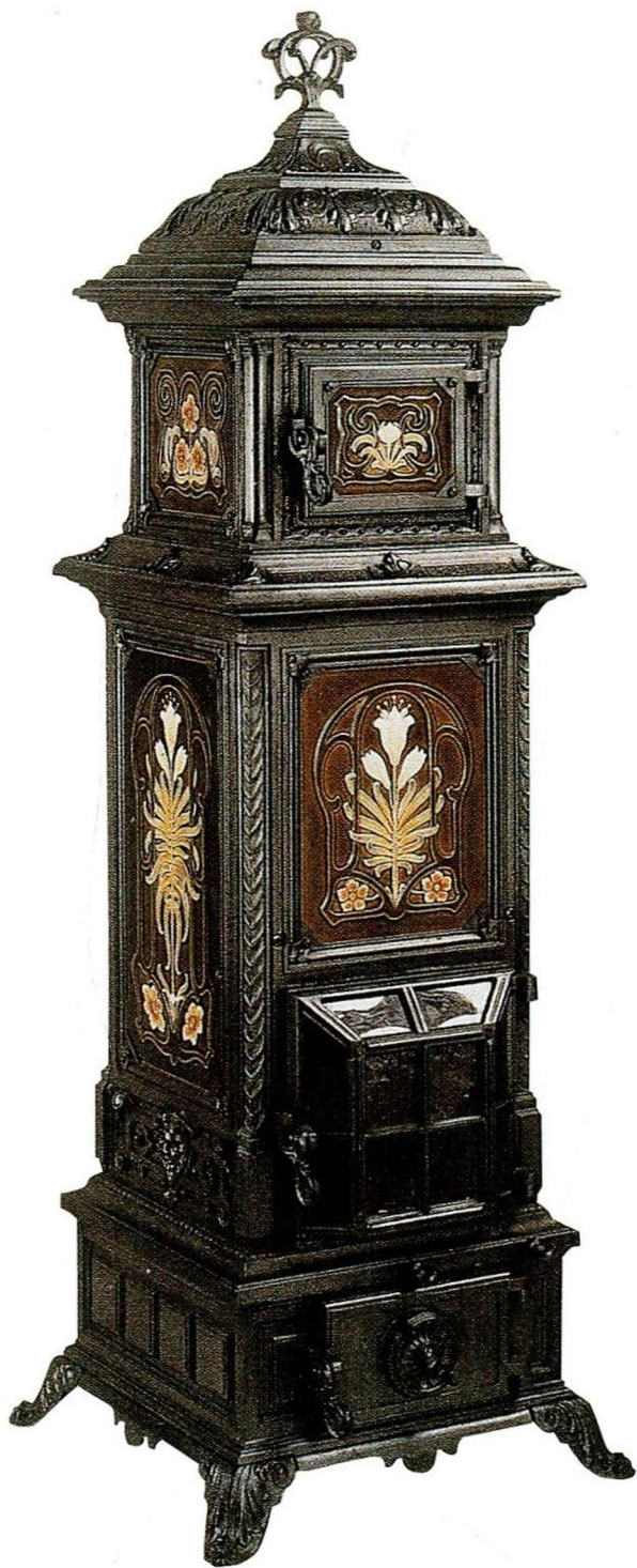
Le parisien (1895).