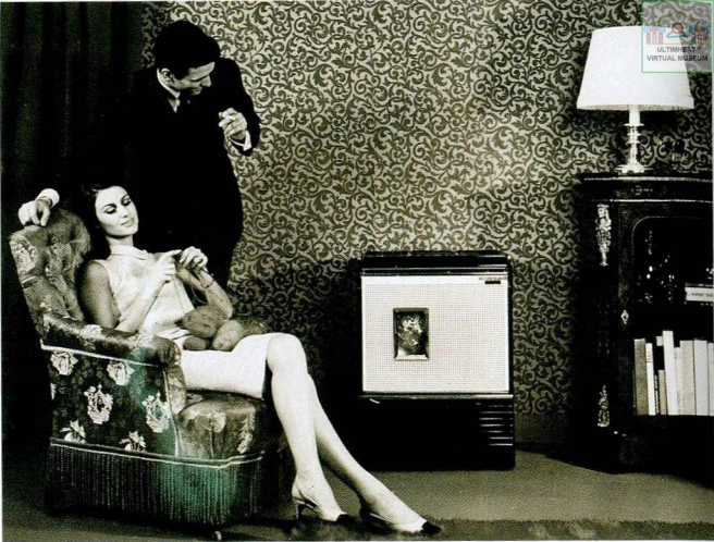
Image d'un foyer heureux dans les années 50 (avec un poêle De Dietrich).