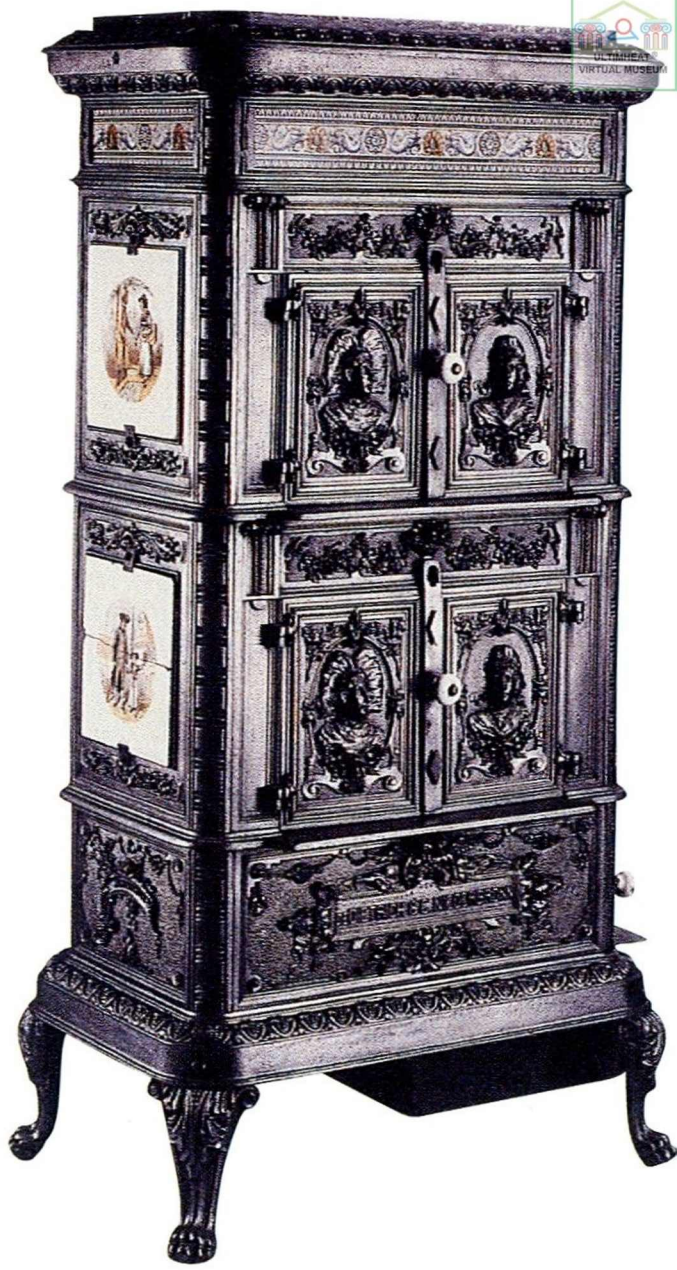
Le poêle Alsace - Lorraine (1906).