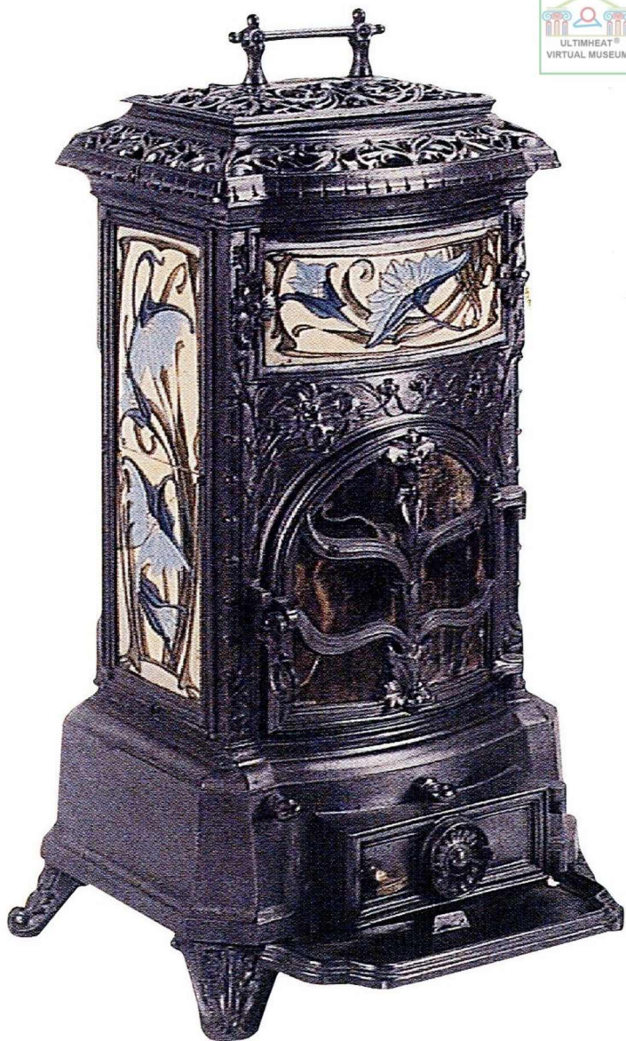
Le calorifère moderne (1895).