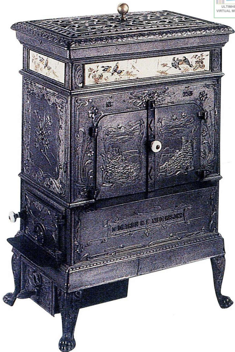
Le vosgien (1900).